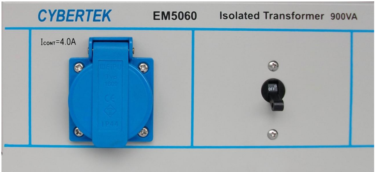
图2 人工电源网络面板